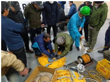
〔蔵王中央ロープウェイ〕

蔵王中央ロープウェイ、蔵王スカイケーブルおよび特殊索道すべてにおいて、スノーシーズン前に1回、訓練を行っております。