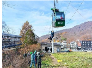
〔蔵王スカイケーブル〕