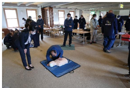
〔従業員講習・AED 訓練〕