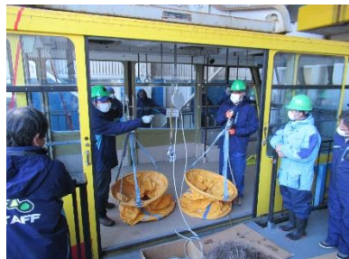
〔蔵王中央ロープウェイ〕

蔵王中央ロープウェイは年2回、蔵王スカイケーブルおよび特殊索道はスノーシーズン前に1回行っております。