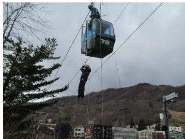
〔蔵王スカイケーブル〕