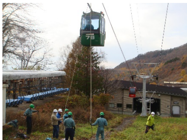
〔蔵王スカイケーブル〕