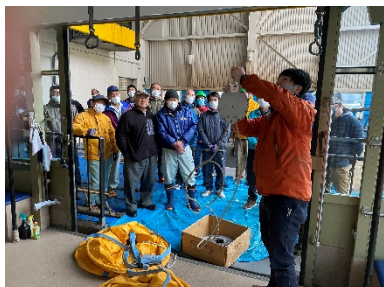
〔蔵王中央ロープウェイ〕

蔵王中央ロープウェイは年2回、蔵王スカイケーブルおよび特殊索道はスノーシーズン前に1回行っております。