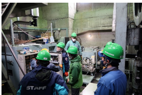
〔蔵王中央ロープウェイ〕

蔵王中央ロープウェイは年2回、蔵王スカイケーブルおよび特殊索道はスノーシーズン前に1回行っております。