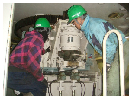
〔蔵王スカイケーブル〕