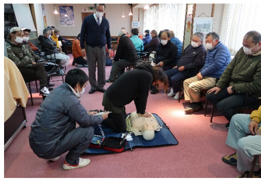
〔従業員講習・AED 訓練〕