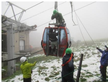
〔蔵王スカイケーブル〕