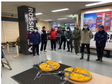
〔蔵王中央ロープウェイ〕

蔵王中央ロープウェイは年2回、蔵王スカイケーブルおよび特殊索道はスノーシーズン前に1回行っております。