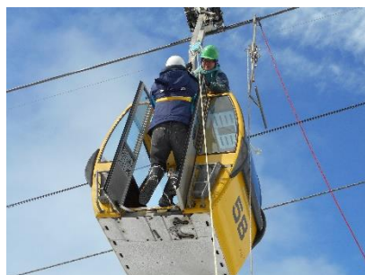
〔蔵王スカイケーブル〕