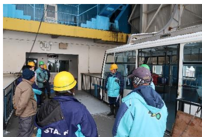
〔蔵王中央ロープウェイ〕