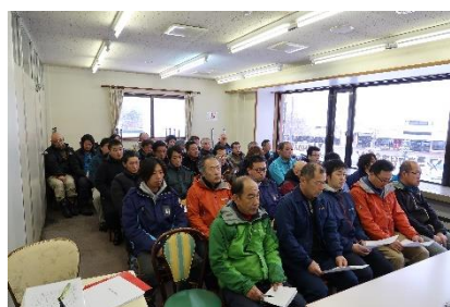
〔従業員講習・説明会〕