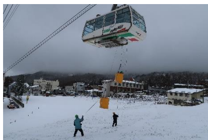
〔蔵王中央ロープウェイ〕