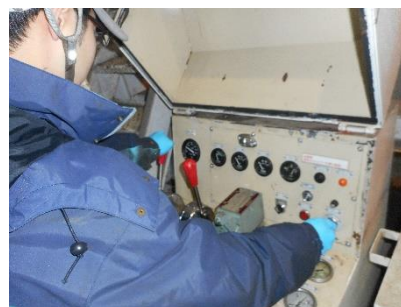
〔蔵王スカイケーブル〕