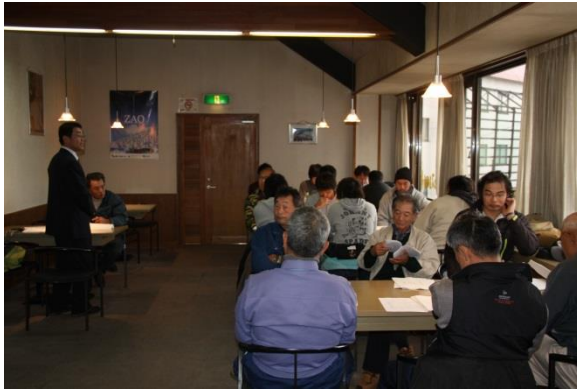
〔特殊索道従事者講習会〕