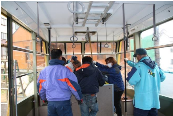
〔中央ロープウェイ救助訓練〕