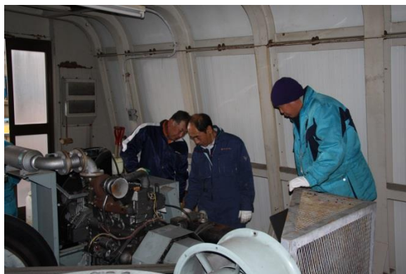
〔予備原動機取扱講習〕