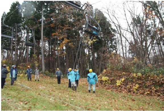
〔特殊索道救助訓練〕