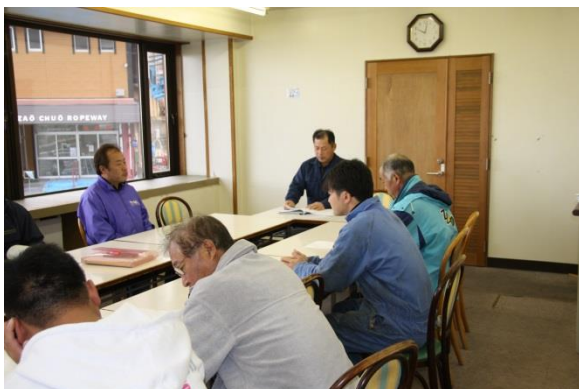
〔中央ロープウェイ従事者講習会〕